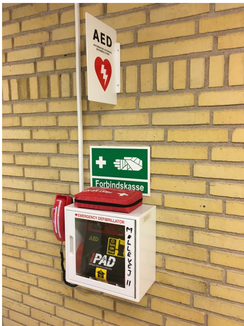
Telefon, AED og forbindingskasse findes i gangarealet mellem bassin og hoveddør